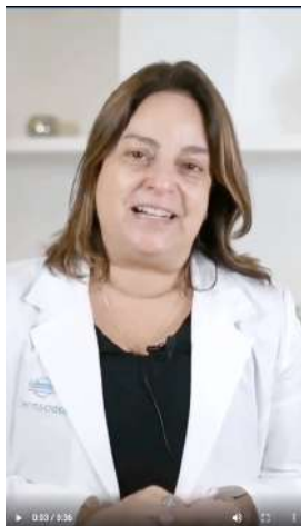
01/01/22 | Bienvenida al 2022