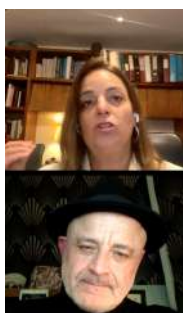
Septiembre: Testimonio de un paciente