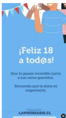
18/09/21 | Saludos fiestas patrias