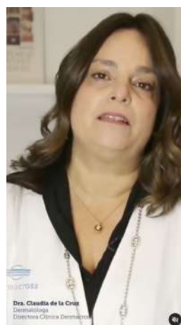
21/09/21 | Cuántas personas tienen psoriasis en Chile