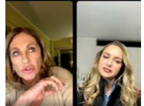
Abril: Asociación de pacientes