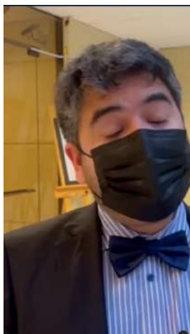
25/08/22 | Saludo por aniversario