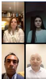
Octubre: Día Mundial de la Psoriasis