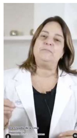
24/12/21 | Saludo de Navidad