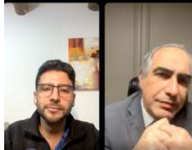
Junio: Ley Ricarte Soto