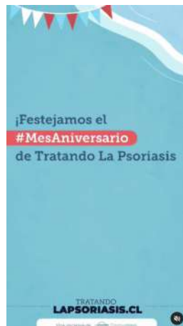
23/08/21 | Saludos aniversario Campaña