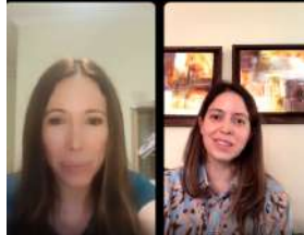
Febrero: Campaña 2022