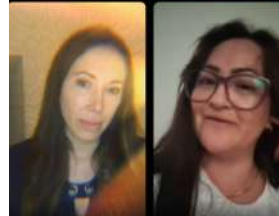
Marzo: Psoriasis en mujeres