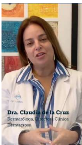
12/08/22 | Saludo por aniversario