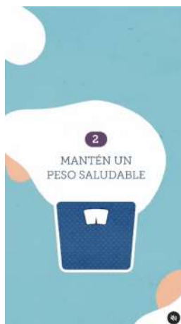
14/07/21 | 5 cosas a tener en cuenta si tienes psoriasis