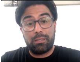
Enero: Psoriasis y el Verano