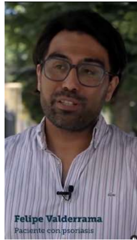
28/03/22 | Testimonio de paciente