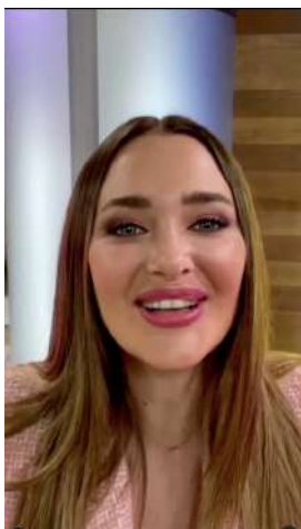
19/08/22 | Saludo por aniversario