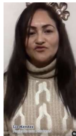
26/08/21 | Saludos aniversario Campaña