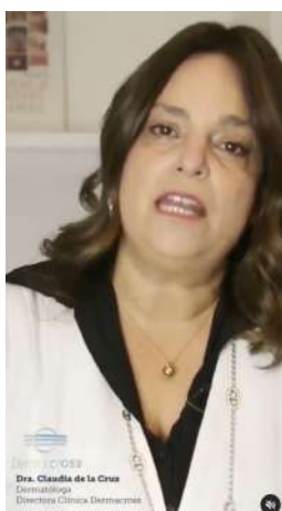
15/09/21 | A quiénes afecta la psoriasis