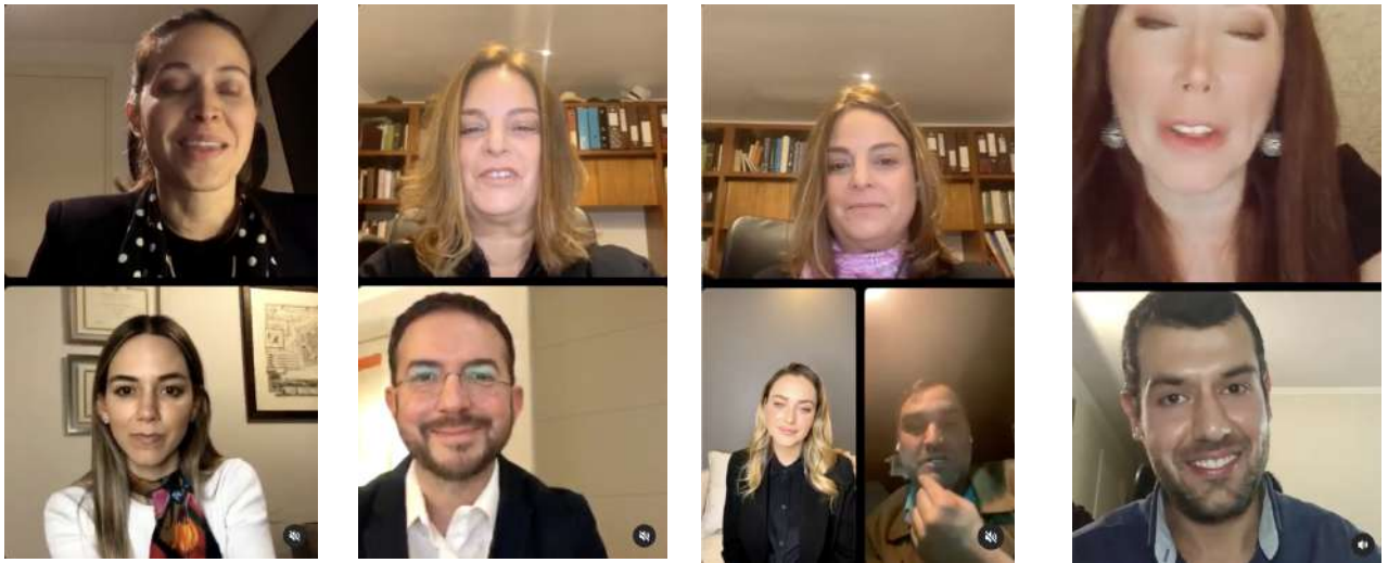
Junio: Psoriasis y Alimentación Julio: Estudio de incidencia en Chile Agosto: Aniversario Campaña Septiembre: Respondiendo preguntas