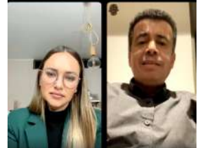
Agosto: 2do Aniversario Campaña