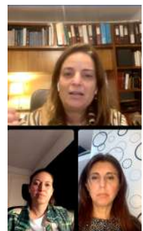
Noviembre: Campaña de atención