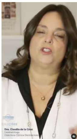
12/07/21 | Qué es la Psoriasis