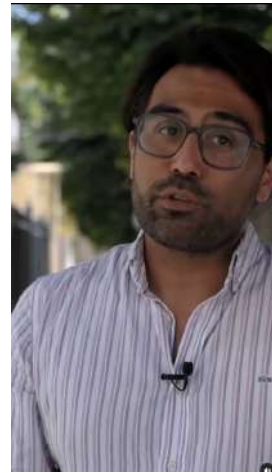
20/04/22 | Testimonio de paciente