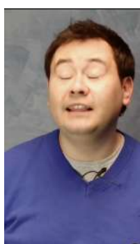
06/10/22 | Testimonio de paciente