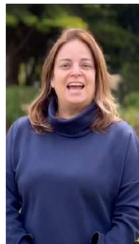
18/09/22 | Saludo de Fiestas Patrias