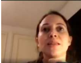
Mayo: Preguntas y Respuestas