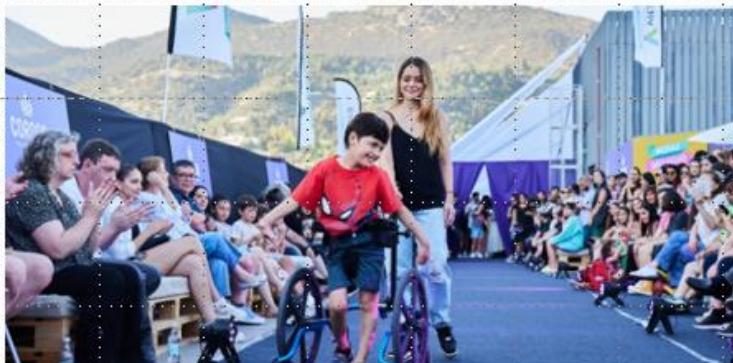
Ossom, 29 de noviembre 2022