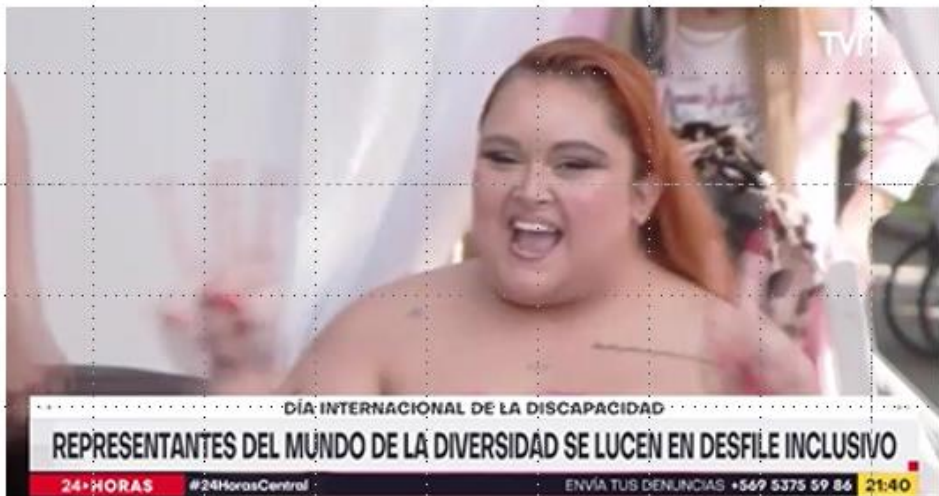
TVN, 5 de diciembre 2022