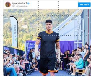
Publitrómetro, 1 de diciembre 2022