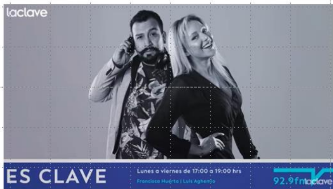
La Clave, 1 de diciembre 2022