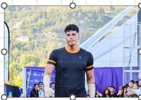
Publmetro, 1 de diciembre 2022

El exchico reality retomó una de sus grandes pasiones gracias a una multitienda.