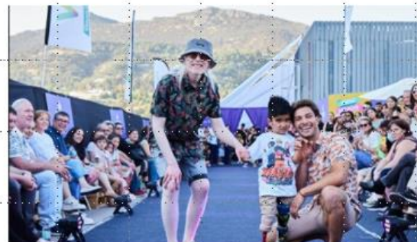
América Retail, 29 de noviembre 2022

Publicación por América Retail - Pro Búsqueda - 29 de noviembre 2022