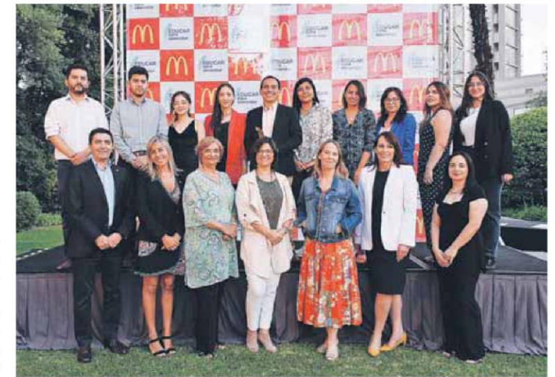
▲ Periodistas de todo el país participaron en la premiación del concurso Educar para Alimentar de McDonald's.

trabajos publicados en 43 medios de comunicación de todo el país. Mientras que la revista Nueva Mujer de Publimetro fue reconocida como el "Medio Revelación 2019". Este año Educar para Alimentar contó con un panel de expertos compuesto por el Colegio de Periodistas; Revista Ya; las escuelas de nutrición y salud de la Universidad de Los Andes y AIEP; y la Asociación Chilena de Gastronomía. 🍴