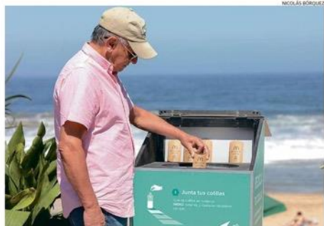
EL RECLAJE DE COLILLAS SE LANZÓ COMO UNA DE LAS ACTIVIDADES DEL PROGRAMA "VERANO SEGURO".

Al disponer de la tecnología adecuada, Imeko tiene como objetivo final procesar el