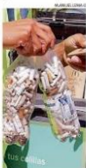
LOS PUNTOS DE RECLAJE.

La empresa Imeko mediante un proceso químico remueve todas las