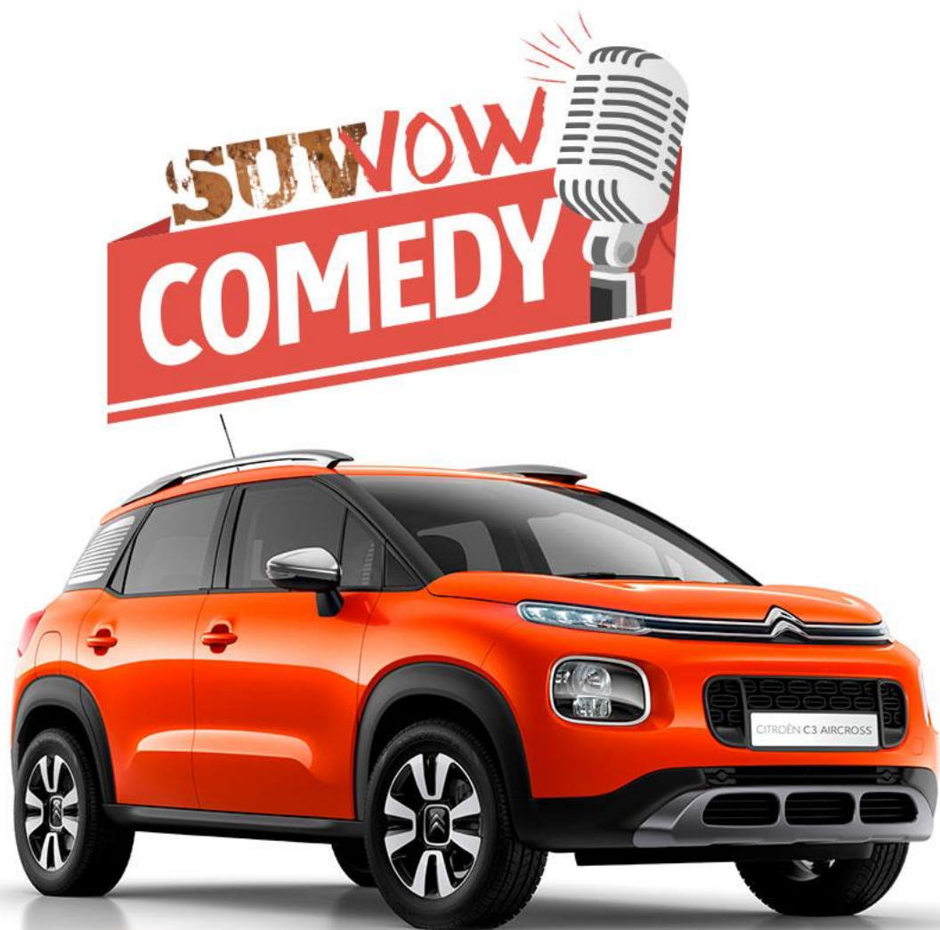
NEW SUV CITROËN C3 AIRCROSS