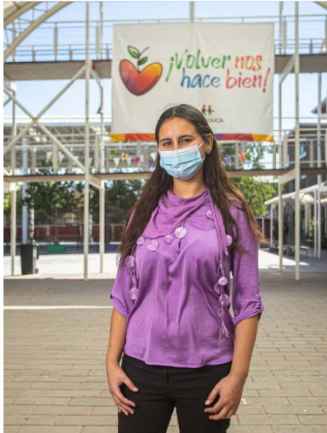
Lienzos en ingresos de colegios