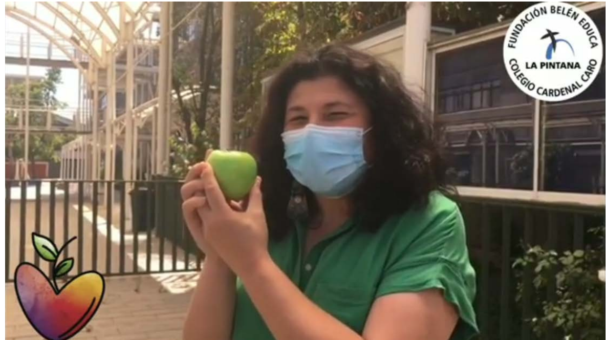
Apropiación en colegio y creación de contenido https://youtu.be/NHQpBzVJn7Q