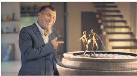
La parata a Messi en la Copa América 2015 en forma de tráfico y el look de dandy en su casa ficticia de Bolonia. El spot del Pitbull muestra varios matices.