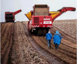
En el campo, el riego y la mecanización son claves para mejorar la productividad y reducir el impacto ambiental.

Agencia de Inversión y Comercio Exterior (AICE) y el Fondo de Inversión Extranjera (FIE) de Chile, que se encarga de atraer inversión extranjera directa (IED) al país, ha impulsado el desarrollo de la agricultura sustentable en Chile, a través de la implementación de proyectos de inversión en el sector agrícola. En este contexto, el cultivo de papas ha sido uno de los más beneficiados por estas iniciativas, gracias a la implementación de tecnologías y prácticas sostenibles que mejoran la productividad y reducen el impacto ambiental.