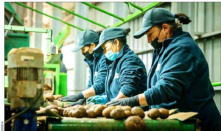
Lay's y Mom's son marcas que se elaboran con papas producidas en campos del país.

El evento se enmarca dentro de un proceso de transformación estratégica de la compañía, que impulsa el desarrollo sostenible.