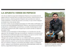
El cultivo de papas verdes es una alternativa sostenible que aporta nutrientes y reduce el uso de pesticidas.

LA APUESTA VERDE DE PEPSICO PepsiCo ha lanzado una iniciativa llamada 'Verde de PepsiCo', que busca promover el cultivo de papas verdes. Este tipo de papas son ricas en nutrientes y requieren menos pesticidas que las papas tradicionales. La empresa espera que esta iniciativa contribuya a una agricultura más saludable y sostenible.