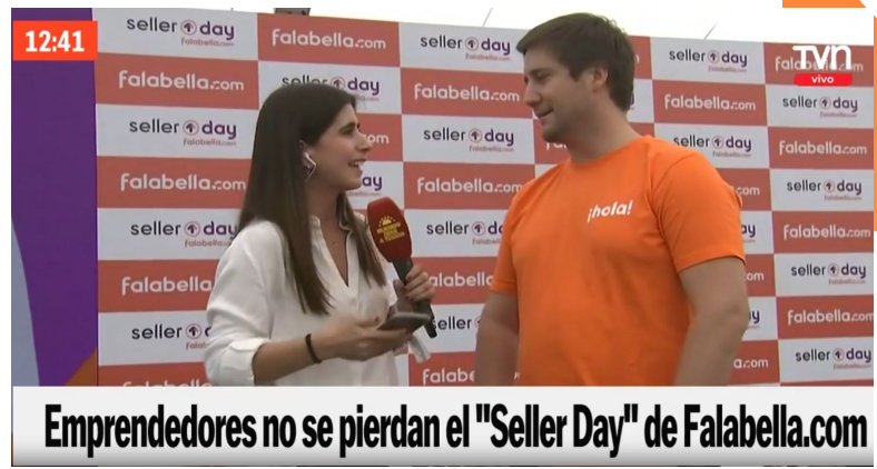
Emprendedores no se pierdan el "Seller Day" de Falabella.com