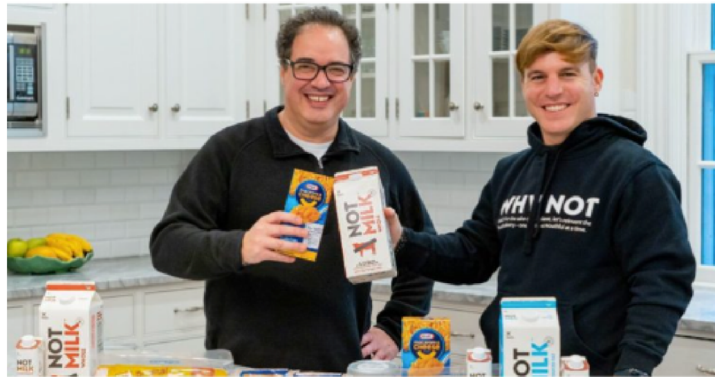
NotCo 2,082 visitas

Por Verónica Reyes Con información de Comunicado de Prensa.